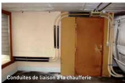
Conduites de liaison à la chaufferie

L'option 1 ayant été rapidement écartée, restait la PAC air-eau et le chauffage aux pellets. L'inconvénient de la PAC était d'une part son rendement annuel (COPa) assez médiocre compte tenu de la faible qualité thermique de l'enveloppe de la villa, du système de chauffage à haute température (pas de chauffage au sol) et du fait de son fonctionnement à l'électricité, ce que le propriétaire ne souhaitait pas pour son chauffage.