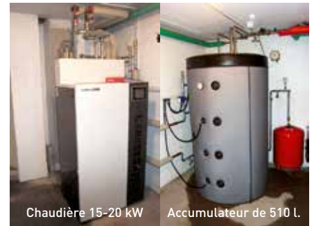
Chaudière 15-20 kW