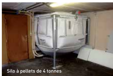
Silo à pellets de 4 tonnes

Les dimensions du local de la chaufferie ont permis l'installation d'un boiler de 510